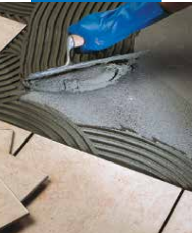
Polaganje jednom pečenih pločica na cementni estrih