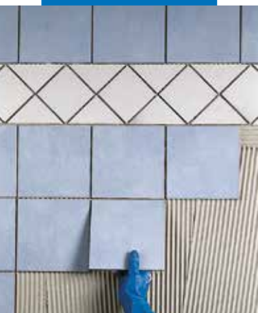
Polaganje jednom pečene pločice na zid od gips kartonske ploče