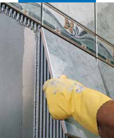
Polaganje jednom pečenih pločica na ožbukani zid