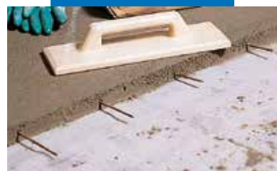
Detalj Topcema s armaturnim šipkama