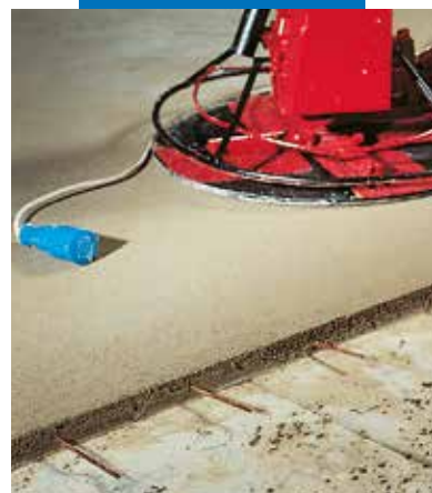
Strojno zaglađivanje površine Topcem-a