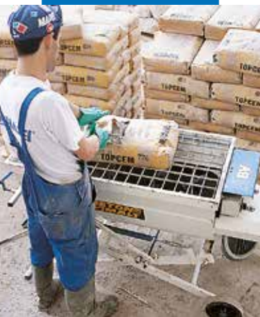
Miješanje Topcem-a u mini miješalici