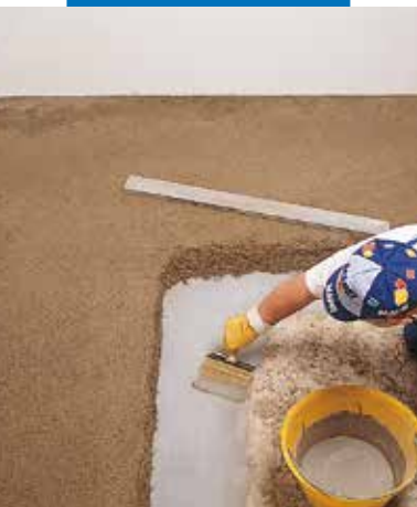
Nanošenje veznog sloja za Topcem