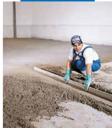
Priprema vodilica za visinu

Sve relevantne reference o proizvodu mogu se dobiti na zahtjev ili na mapei web stranicama www.mapei.hr i www.mapei.com