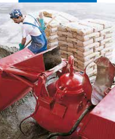
Miješanje Topcem-a u miješalici s automatskom pumpom