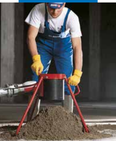
Priprema Topcem mješavine