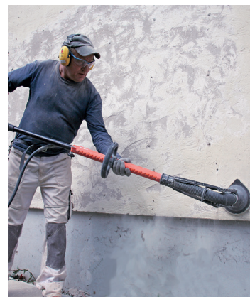
Uklanjanje stare boje i žbuke