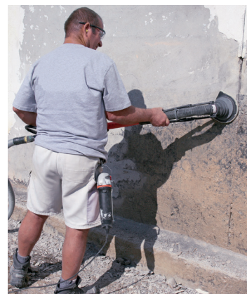
Brušenje bitumenskog premaza sa PCD brusnim diskom