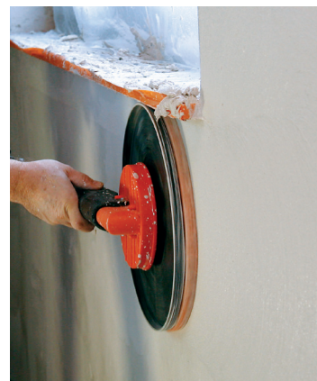
Podesiva kontrola brzine