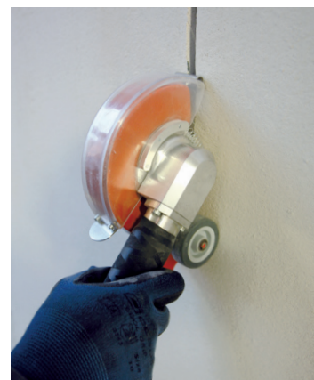
Za glodanje proreza za kablove u betonu ili cigli