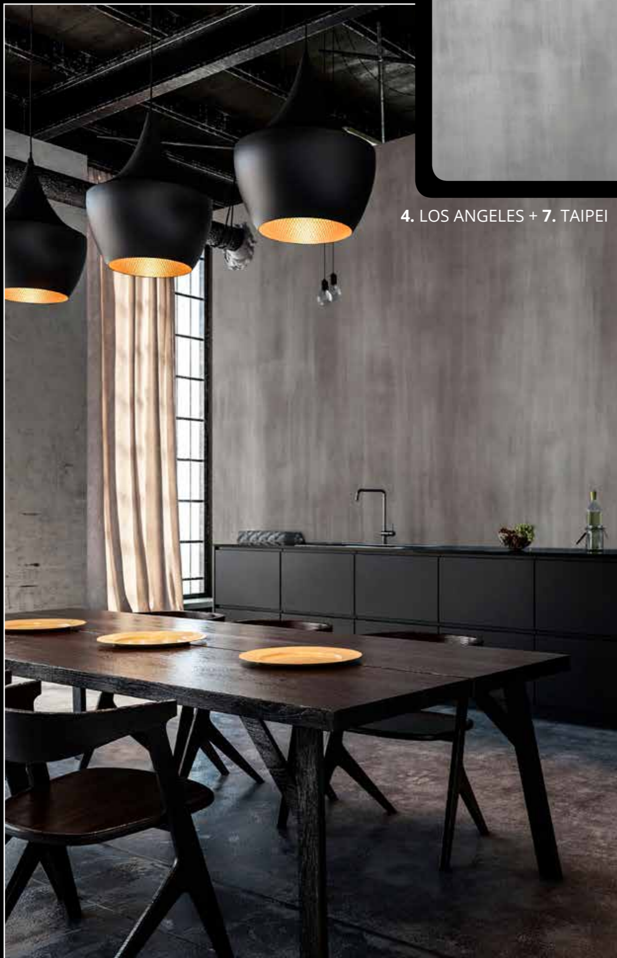
4. LOS ANGELES + 7. TAIPEI