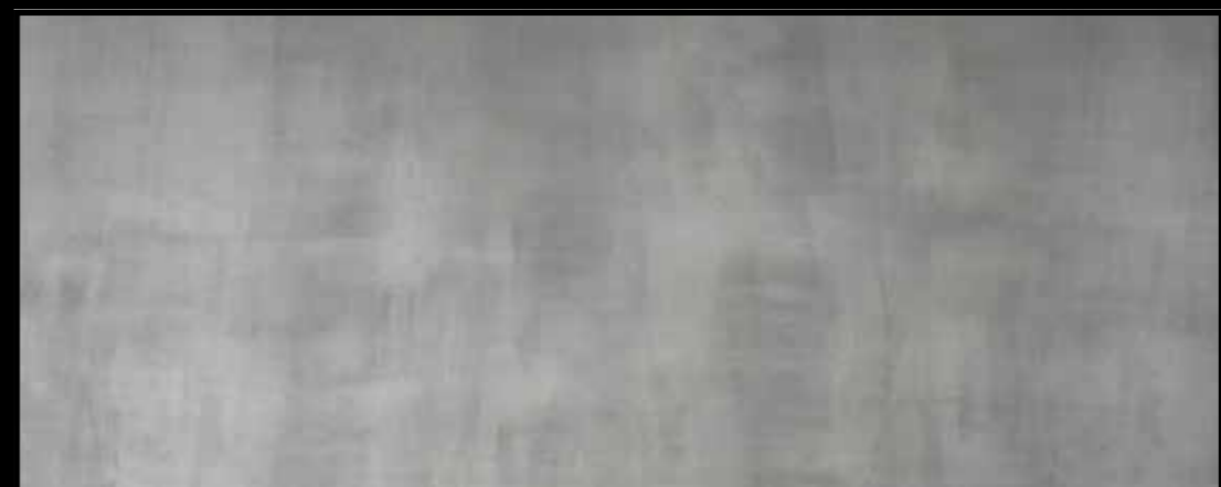
5. MILAN + 7. TAIPEI