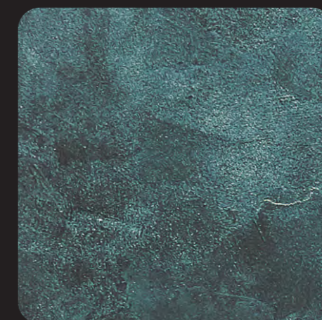
5. ZELENA PATINA