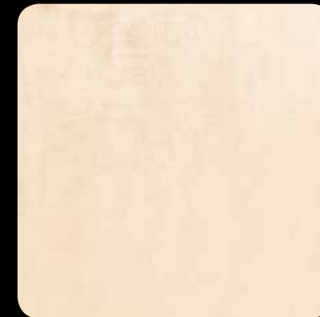
3. SIENA NATUR