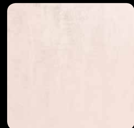
10. SPALJENO SMEĐA