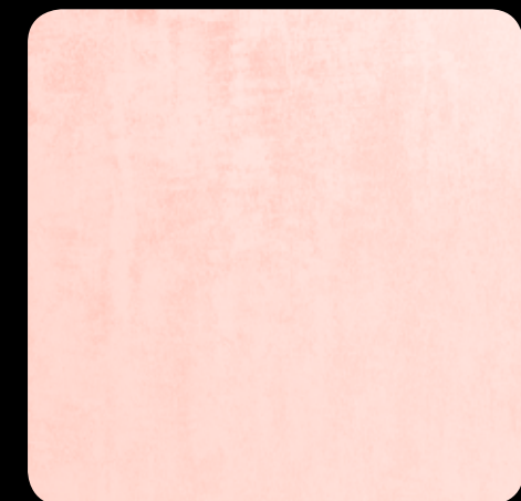
6. OKSIDNO CRVENA