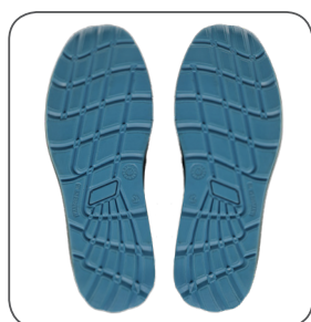
podešev outsole podeszwa